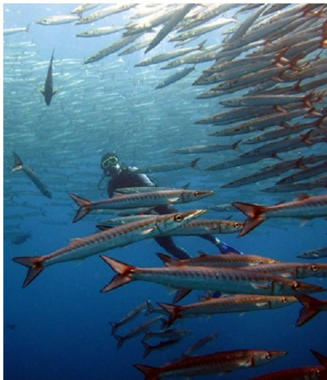
Buceo en Malpelo.

Debido a la pesca indiscriminada y poco sostenible que se ha venido realizando en el mundo entero, se creó un área adjunta al SFF Malpelo, el Distrito Especial de Manejo Yurupari, una de las zonas de mayor impacto por la pesca industrial atunera que ahora es manejada entre las instituciones ambientales, la Armada Nacional de Colombia, la Autoridad Nacional de Pesca y Acuicultura (Aunap) y el sector pesquero indus-